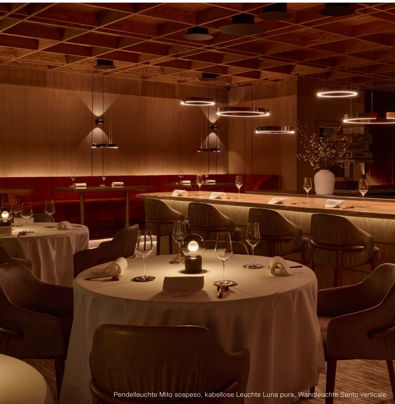
Pendelleuchte Mito sospeso, kabellose Leuchte Luna pura, Wandleuchte Sento verticale

Das Restaurant erstreckt sich über zwei Ebenen, von denen jede ein individuelles Ambiente bietet. Das Erdgeschoss besticht durch raffinierte Eleganz: intime Tische, bequeme Sitzbänke und eine imposante Bar, die durch mehrere Mito sospeso in warmes, einladendes Licht getaucht wird. Diese Leuchten schaffen eine Atmosphäre, die an die Gemütlichkeit eines Kaminfeuers erinnert.