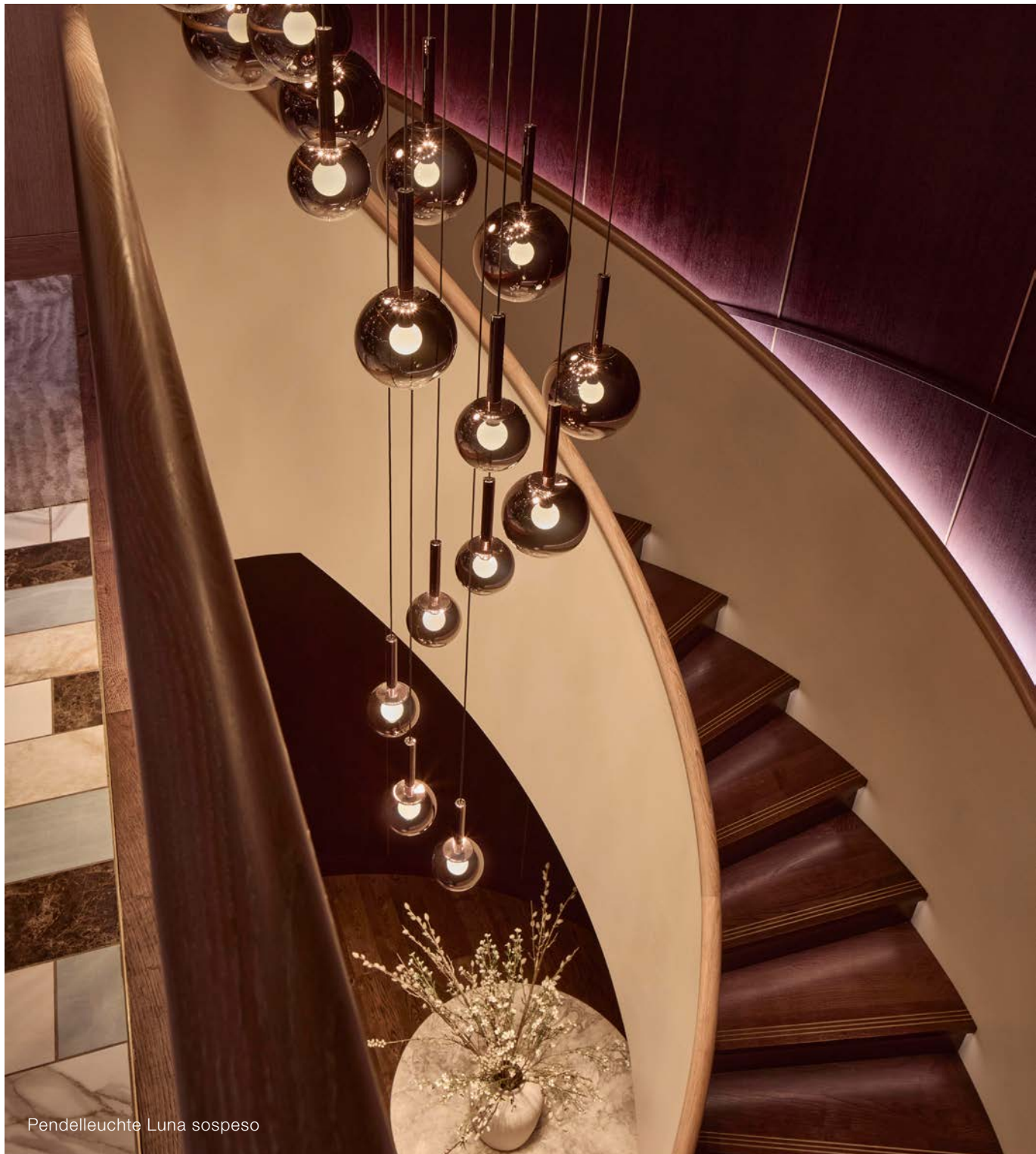
Pendelleuchte Luna sospeso

Ein besonderer Blickfang ist der Luna sospeso Chandelier in Form einer Doppelhelix, der über der geschwungenen Wendeltreppe schwebt und die beiden Etagen visuell miteinander verbindet. Diese eindrucksvolle Lichtinstallation führt die Gäste in die untere Ebene, die eine Lounge-ähnliche Atmosphäre bietet. Hier können sie entspannt Platz nehmen und das exklusive Speiseerlebnis fortsetzen.