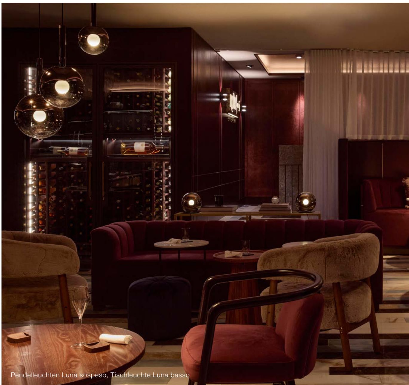
Pendelleuchten Luna sospeso, Tischleuchte Luna basso

Row on 5 zeigt eindrucksvoll, wie Lichtdesign und Kulinarik harmonisch ineinandergreifen können, um ein einzigartiges Erlebnis zu schaffen. Das fein abgestimmte Zusammenspiel von Raum, Licht und Geschmack verwandelt das Restaurant in einen Ort, an dem jeder Moment magisch und unvergesslich wird.