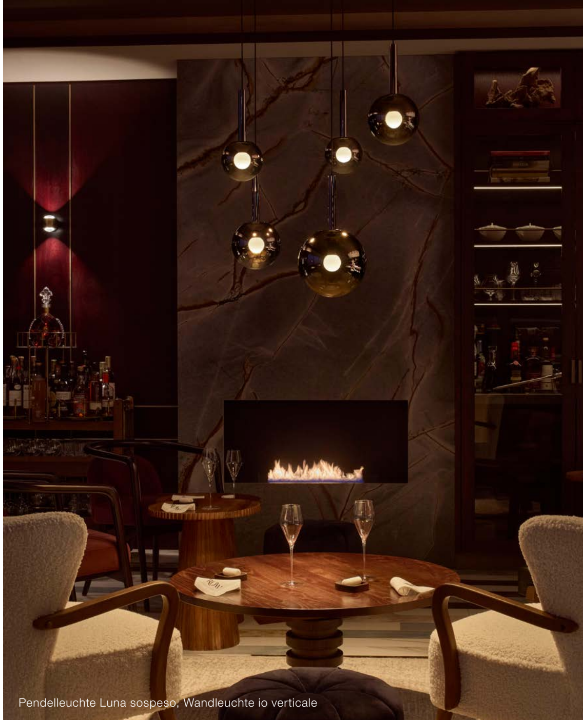
Pendelleuchte Luna sospeso, Wandleuchte io verticale

Der VIP-Weinraum im Untergeschoss wird durch mehrere Mito cosmo move beleuchtet – elegante, flexible Deckenleuchten, die bei Bedarf herabsinken und den Raum mit einer faszinierenden Kombination aus Licht und Bewegung bereichern.