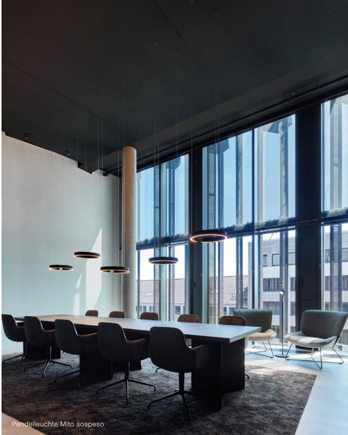
Pendelleuchte Mito sospeso