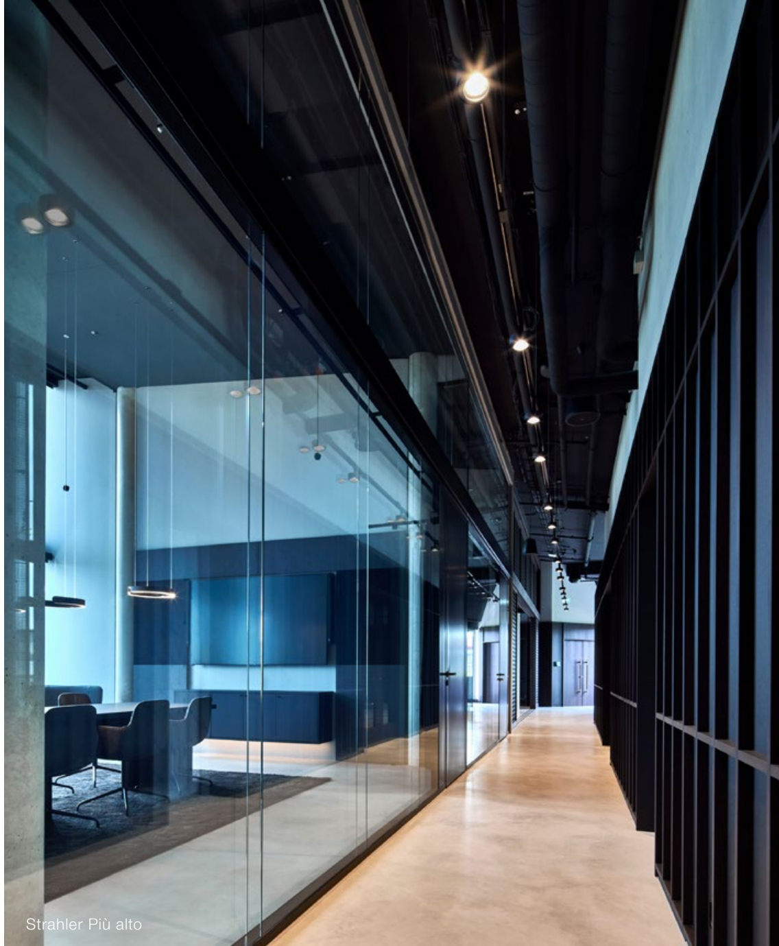
Strahler Più alto