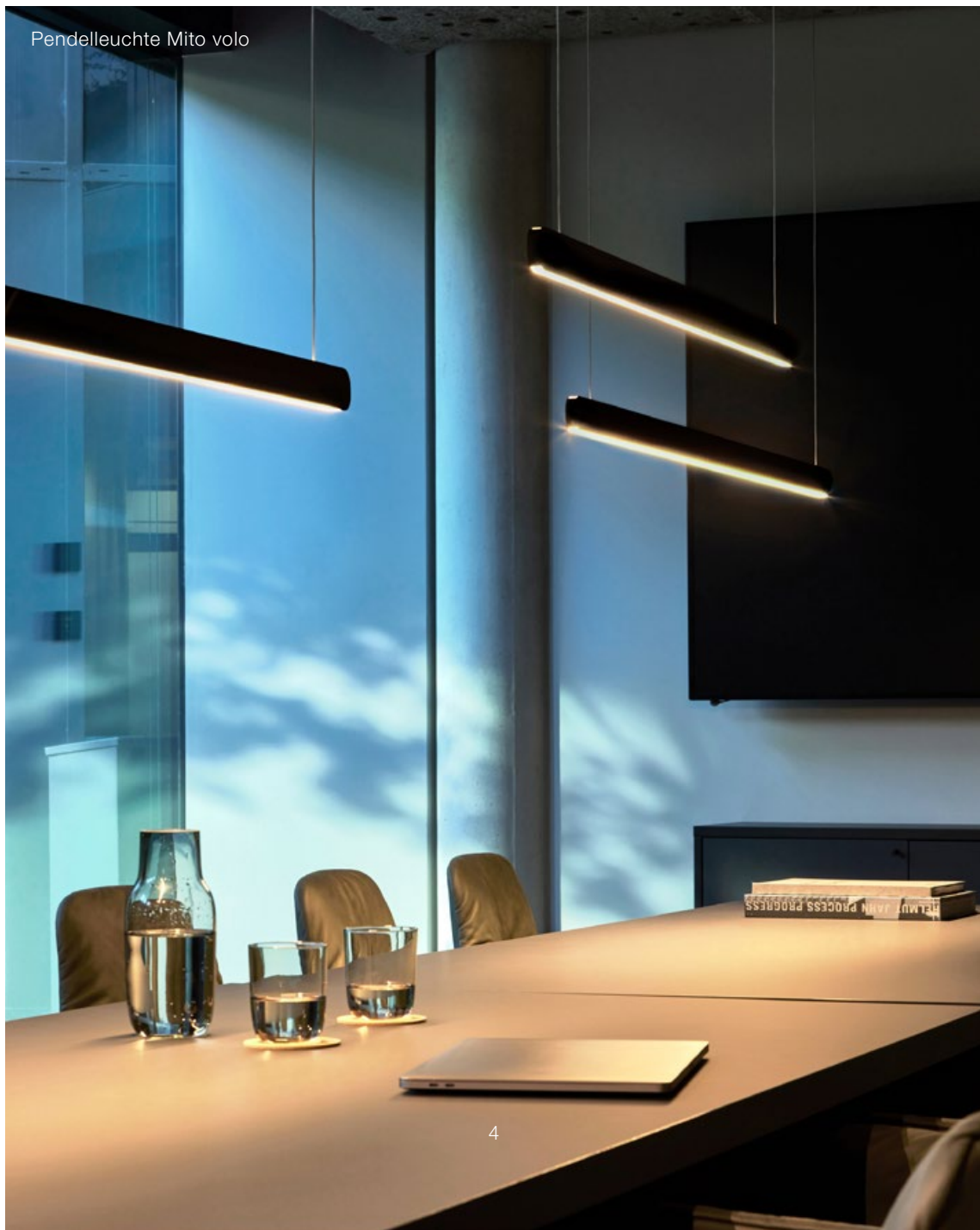
Pendelleuchte Mito volo

Ein Konzept, ein System, jedoch niemals gleich: Verschiedene Settings erfordern unterschiedliche Rahmenbedingungen, die manchmal völlig im Kontrast zueinander stehen. Open Space Layouts mit Arbeitsplätzen erfordern anderes Licht als gemütliche Meeting Points mit Sitzinseln, Telefonboxen, Kreativzonen oder Meetingräume. So wurde der Boardroom der Gerchgroup AG, ein exklusiver Besprechungsraum, mit Leuchten der Serie Mito linear ausgestattet, mit denen sich eine anlassbezogene Lichttemperatur einstellen lässt. Von aktivierend kühl bis einladend warm reicht die Palette der Beleuchtung. An den Arbeitsplätzen selbst können mit mobilen Stehleuchten, die mit Tageslicht- und Präsenzsensoren ausgestattet sind, individuelle Lichtszenarien entworfen werden.