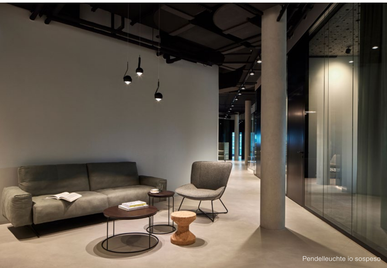
Pendelleuchte io sospeso